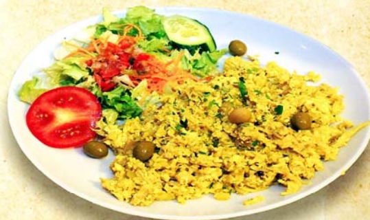
★ Morue «à Brás» ★

Un apéritif au choix. Entrée dégustation: 3 Beignets mixtes, Gésiers en sauce et Chorizo flambé. En plateau: Morue à Brás et Alentejana, Salade de fruits, Pudim ou Molotoj, Café. Boissons à volonté pendant le repas: Vins, eaux, jus, sodas, bière (*).