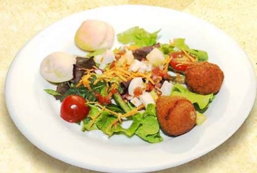
★ Panaché de Salade ★